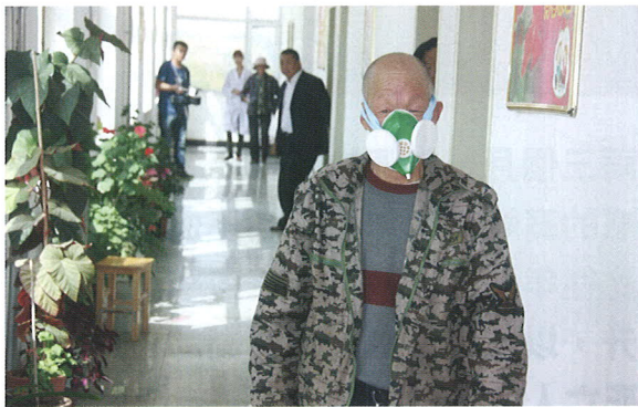
↑ 老年人若肺氣虛衰，會令呼吸功能減退。

現代醫學發現，年老的人呼吸系統肺泡彈性減弱，換氣量減少，容易出現肺氣腫，加上氣道內的分泌物（痰）增多不易排出，逐漸形成慢性阻塞性肺病，影響呼吸功能，令患者不能正常吸納氧氣，導致肺小動脈痙攣而肺動脈壓力上升，呼吸困難更加嚴重，形成惡性循環。